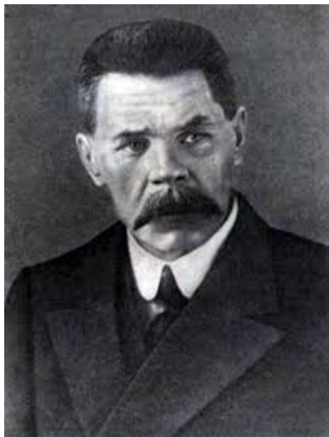
மாக்சிம் கோர்க்கியின் On the Art and Craft of Writing என்னும் நூல் தமிழில்